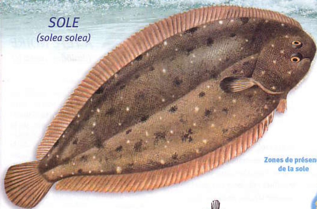
Zones de présence de la sole